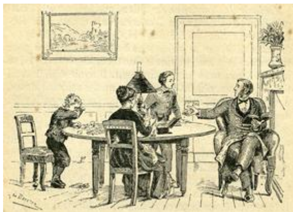
Illustration tirée de « Le livre de l'école » 35 e édition de 1899

« Nombre de Français ignorent les lois et la constitution de leur pays, et cette ignorance est déplorable. Pour qu'elle cesse, il faut se résoudre enfin à enseigner à l'écolier ce que l'homme doit savoir. Or, il n'est pas plus difficile de donner aux enfants des notions de législation usuelle et d' instruction civique que de leur apprendre la grammaire et l'arithmétique : le tout est d'employer la bonne méthode [1]. »